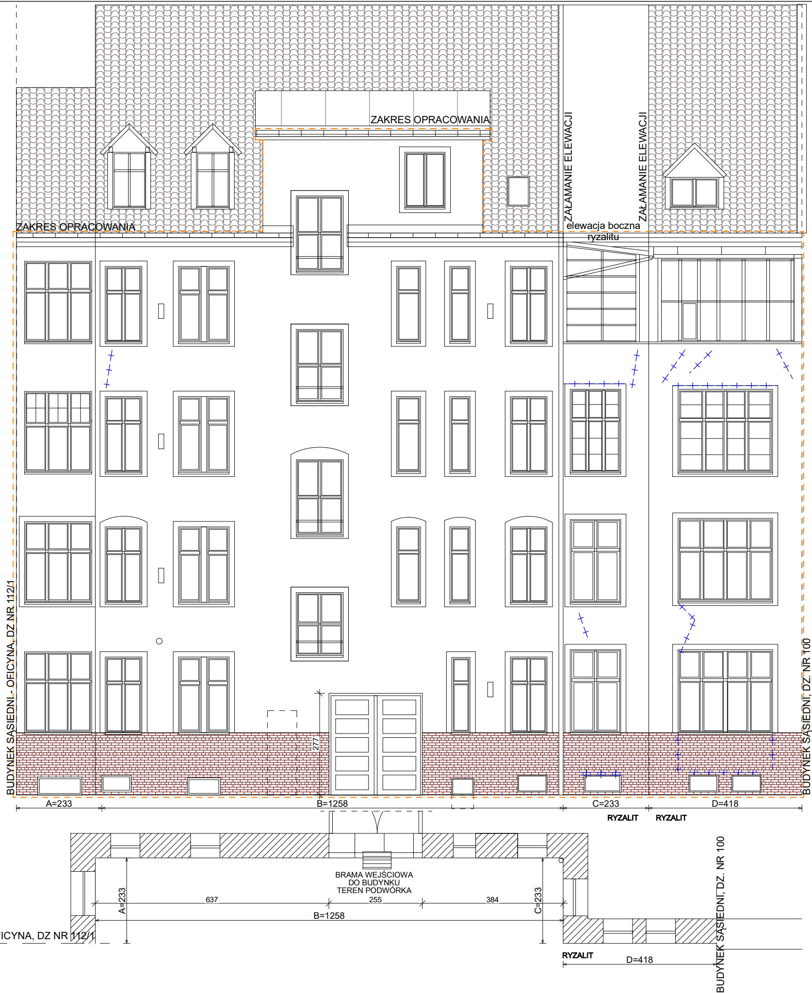
BUDYNEK SĄSIEDNI - OFICyna, DZ NR 112/1